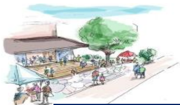
(仮) にぎわい交流館いわつき